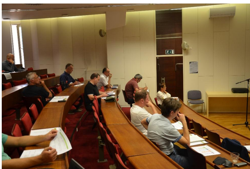
Slika 3: Predstavitev meril in njihovo vrednotenje v okviru strokovne skupine.