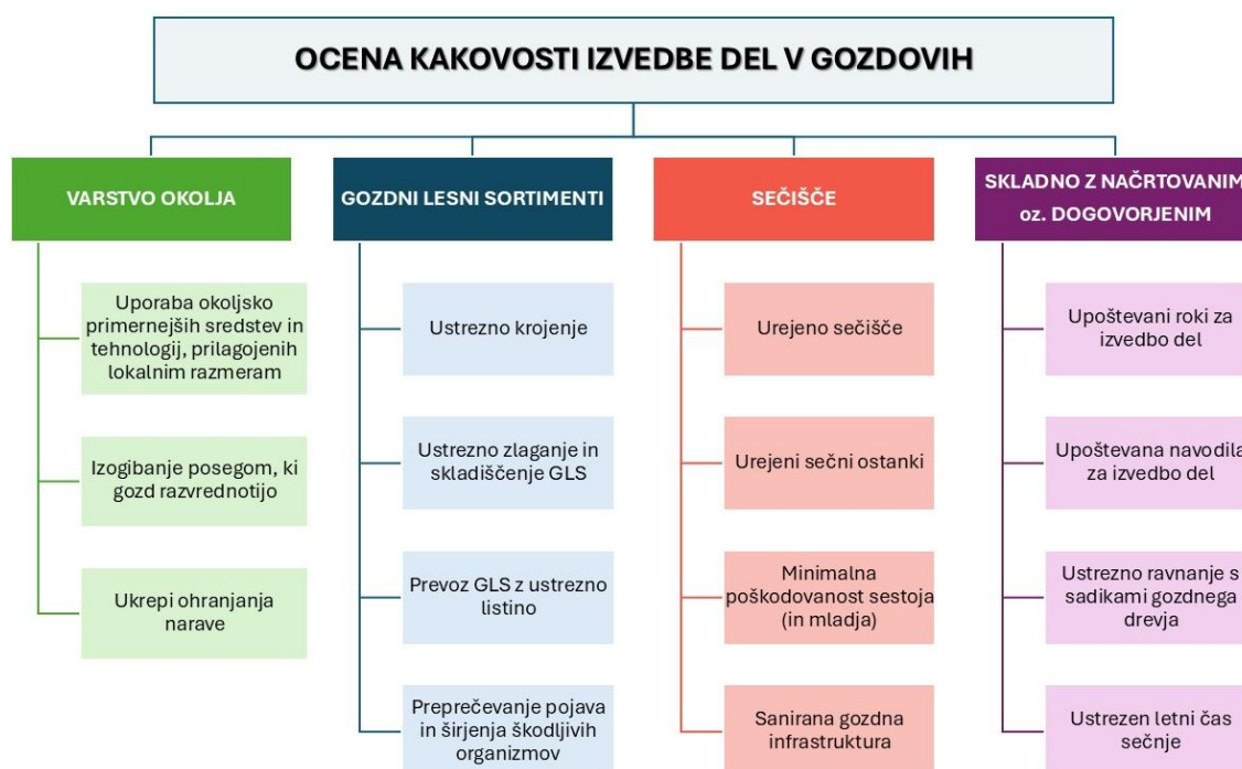
Slika 2: Shematski prikaz načel in meril za oceno kakovosti pri izvajanju del v gozdovih.