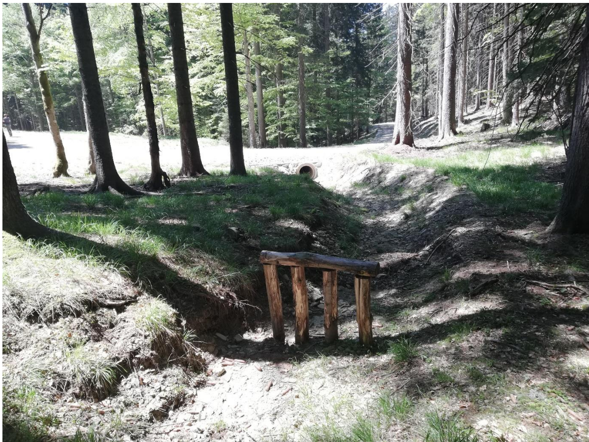
Slika 5: enostaven lovilni element nad cevnim prepustom gozdne ceste, namenjen prestrezanju plavja

Ocena podnebnih sprememb v Sloveniji do konca 21. stoletja. ARSO, Ljubljana 2018