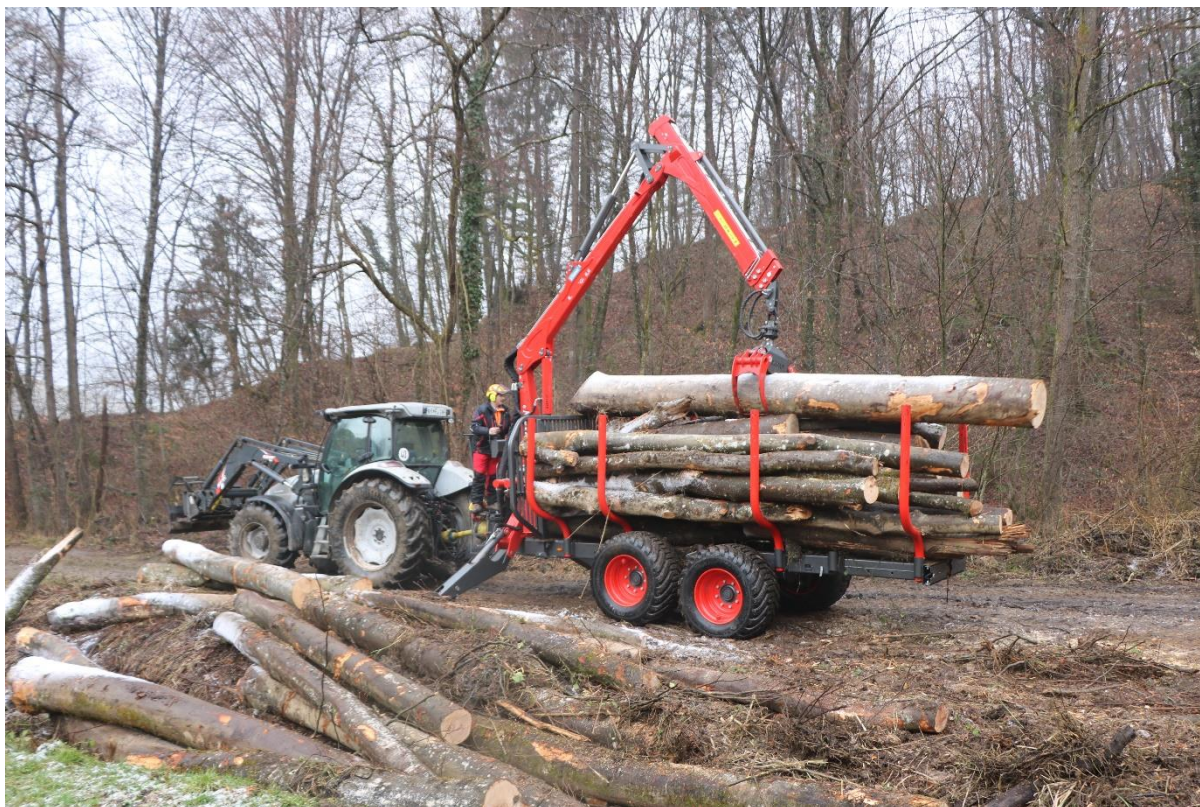
Slika 3: Vlačenje lesa po tleh ni več edina možna raba gozdnih vlak. Obstajajo tudi druge oblike spravila lesa in upravičene rabe vlak, ki ne potrebujejo nujno prečnih naklonov pobočnih vlak navznoter.

V gozdnem prostoru se poleg gozdnih cest, protipožarnih prometnic in gozdnih vlak, namenjenih vlačanju lesa nahaja še veliko drugih »upravičenih« prometnic, ki so lahko po trenutni zakonodaji razvrščene zgolj med gozdne vlake – s tem pa posredno dobijo tudi zahtevo po določenem prečnem naklonu. Tovrstne prometnice bi lahko grobo uvrstili v kategorijo utrjenih gozdnih poti, ki navkljub podanim predlogom iz preteklosti, še ne obstaja. Sem bi se lahko uvrščale pomembnejše gozdne vlake (večinoma utrjene), prednostno namenjene spravilu lesa z vožnjo (npr. z gozdarskimi prikolicami), vaški kolovozi prednostno namenjeni gospodarjenju s kmetijskimi zemljišči, ter servisne poti prednostno namenjene vzdrževanju vodne ali gospodarske infrastrukture v gozdnem prostoru. V kolikor slednje prometnice niso opredeljene kot gozdne vlake, ali izločene iz maske gozda, so po trenutni gozdarski zakonodaji (tudi če so speljane po javnem dobrem, ali z vpisanimi služnostmi) nelegalne. Na vseh teh prometnicah bi morala biti omogočena tudi druga izvedba prečnega naklona, ne izključno na notranjo stran, skladno s priporočili načrtovalca/projektanta.