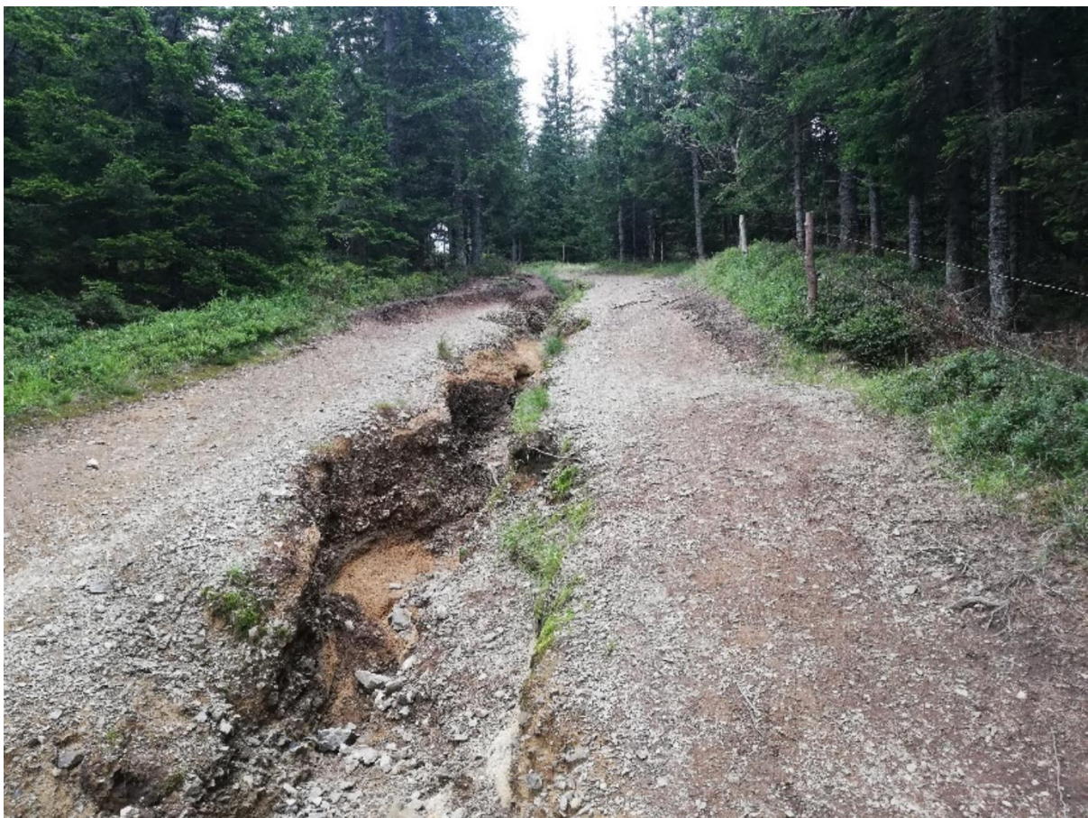
Slika 4: na močno erodibilnih podlagah so lahko že nizki nakloni problematični in je na njih potrebna umestitev prečnih jarkov

V kolikor se bo v prihodnje omogočilo gradnjo odsekov utrjenih gozdnih poti tudi s prečnim nagibom proti zunanji strani, je potreba pri takih poteh po prečnih jarkih bistveno manjša.