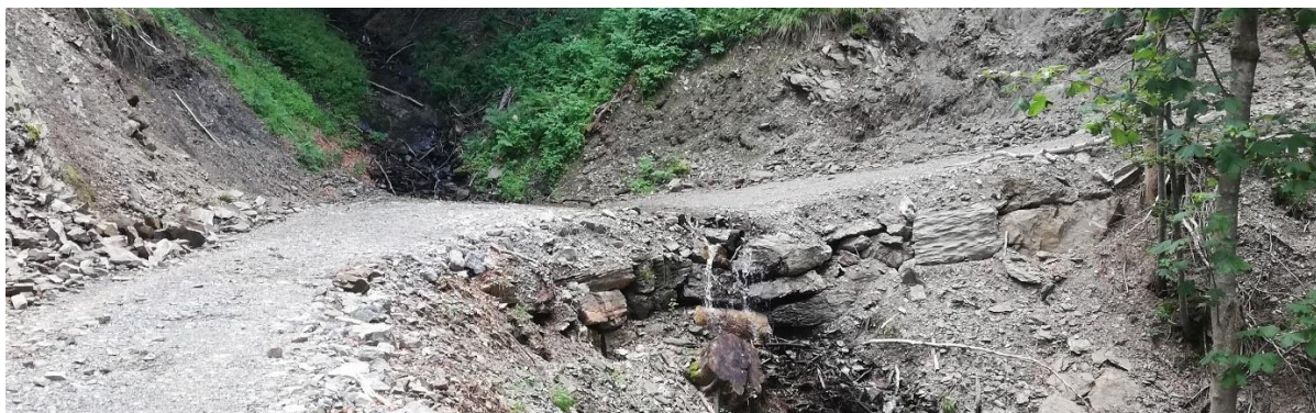
Slika 7: Mulda na gozdni vlaki

Alternativna možnost cevnim prepustom je mulda. Mulda je utrjen krajši odsek gozdne prometnice konkavne oblike, namenjen neoviranemu pretoku vode (načeloma hudournika).