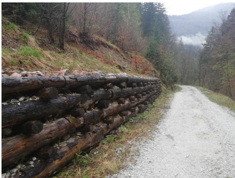
Slika 9: Podporni in oporni elementi bodo detajlneje predstavljeni v naslednjem projektne poročilu (3.3)

Taki elementi so: kamnometi in kamnite zložbe v suhem ali v betonu, kašte, zidovi, gabioni in drugi,... Tem elementom bo detajlno namenjeno poročilo 3.3 (Nabor primernih ukrepov in tehničnih rešitev, ki zagotavljajo varstvo pred erozijo v gozdu).