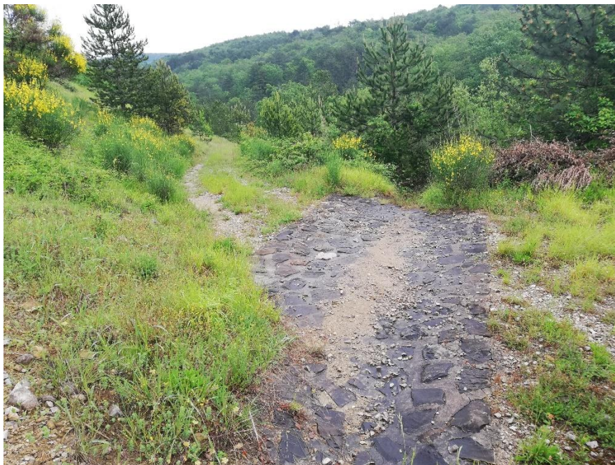
Slika 8: utrjena mulda na gozdni vlaki