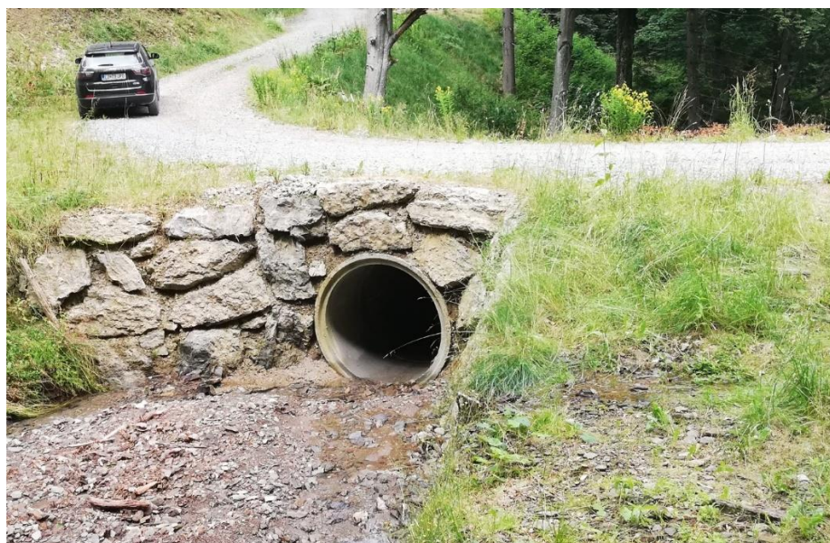
Slika 6: Večji cevni prepust na gozdni cesti

Zaradi vsega naštetega predlagamo poenostavljeno oceno odtoka iz vodozbirnih območij, manjših od okvirno 50 ha, ki bi lahko poenostavila, pospešila in pocenila postopek pridobivanja potrebnih soglasij pri umeščanju novih gozdnih vlak (izjemoma tudi pri nujni gradnji cest) v prostor. Od snovalca vlake bi namreč zadostovalo, da bi ta določil površino vodozbirnega območja in sledil tipskemu predlogu prečkanja iz nadaljevanja. Površina vodozbirnega območja je namreč najlažje določljiva veličina hidravličnih izračunov, v kolikor ni prisotnosti večjih izvirov, ki se napajajo izven vodozbirnega območja površinskih voda. Na slednje moramo biti pozorni predvsem pri različni matični podlagi znotraj vodozbirnega območja. Določitev površine vodozbirnega območja lahko določi že avtor elaborata vlake, ta pa je preverljiva tudi s strani ostalih soglasodajalcev.