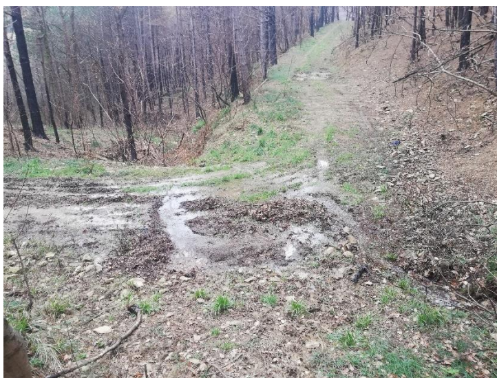
Slika 1: Vzdrževalne ukrepe za vzpostavitev ali povrnitev prevoznosti in zagotovitev odvodnjavanja lahko delajo in načrtujejo upravičeni uporabniki prometnic sami

Vzdrževanje gozdnih vlak pa je v veliki meri prepuščeno samim pooblaščenim uporabnikom. Šele zadnji razpis SKP predvideva tudi sofinanciranje ukrepa »protierozijsko vzdrževanje gozdnih vlak«, ki pa še ni ustrezno definirano in zastavljeno. Za koriščenje sredstev s tega naslova, bo moral ZGS predhodno pripraviti elaborat teh vzdrževanj. In te dotične smernice lahko služijo tudi kot pomoč pri pripravi teh elaboratov.