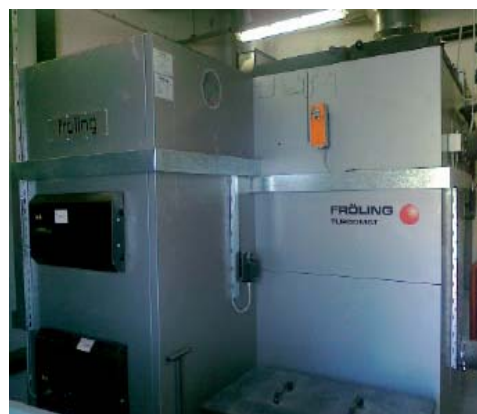
Kotel na lesne sekance proizvajalca Fröling

Dobava sekancev poteka s traktorskimi prikolicami. Sekanci se skladiščijo v pokritem skladišču kapacitete 400 m 3 ob manjšem zalogovniku kapacitete 100 m 3 . V podjetju skladiščijo rezervno količino okroglega lesa, ki bi ga lahko uporabili ob morebitnemu izpadu dobave sekancev.