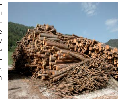
Skladišče lesne biomase

Bodočim investitorjem tako priporočajo, da preučijo svojo energetsko bilanco, pridobijo informacije o alternativnih virih energije ter učinkoviti rabi in sodobnih tehnologijah in se ob realni oceni investicije odločijo za rabo lesne biomase. Izkoristijo naj obstoječe državne podpore ter investirajo v sodobne kvalitetne in preverjene tehnologije ter z lokalnimi dobavitelji dosežejo dolgoročno sodelovanje, ki naj temelji na zaupanju in poštenem odnosu.